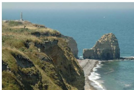
Pointe de Hoc

Vi skal på tur langs invasionskysten fra D-dagen den 6. juni 1944, bl.a. til Omaha, hvor amerikanerne gik i land og hvor nogle af de voldsomste kampe fandt sted. Vi besøger den store amerikanske kirkegård, men vi skal også se det berømte Pointe du Hoc, den stejle klippe, hvor de amerikanske rangers forgæves gik i land. Overnatning i Caen.