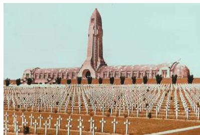
Benhuset i Verdun

Via Holland, hvor vi passerer Arnhem, kører vi til Belgien, som både under 1. og 2. verdenskrig blev slagmark. Overnatning i byen Kortrijk i Flandern/Belgien. Sen aftensmad på hotel.