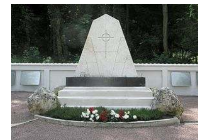
Den danske kirkegård i Braine

Tidlig afgang fra hotel. Via Köln og Hamborg til den dansk/tyske grænse, hvor vi forventes at ankomme ca. kl. 18.30. Ingen ophold ved grænsekiosken.